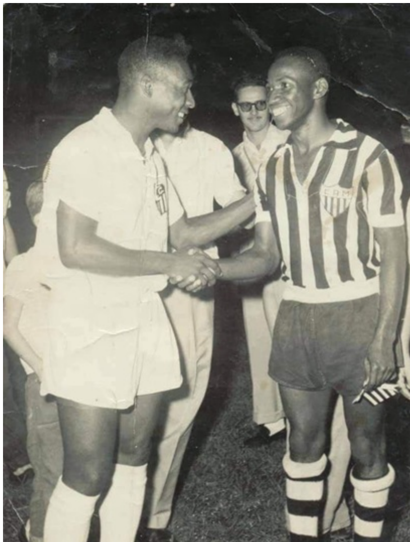
De um lado um ídolo. Do outro Pelé.

https://www.real.fm.br/noticia/1165/artilheiro-da-alegria-silvestre-martins-fernandes-deixou-seu-nome-registrado-na-historia-do-futebol-e-da-cidade-de-itabirito em 07/04/2026 06:03