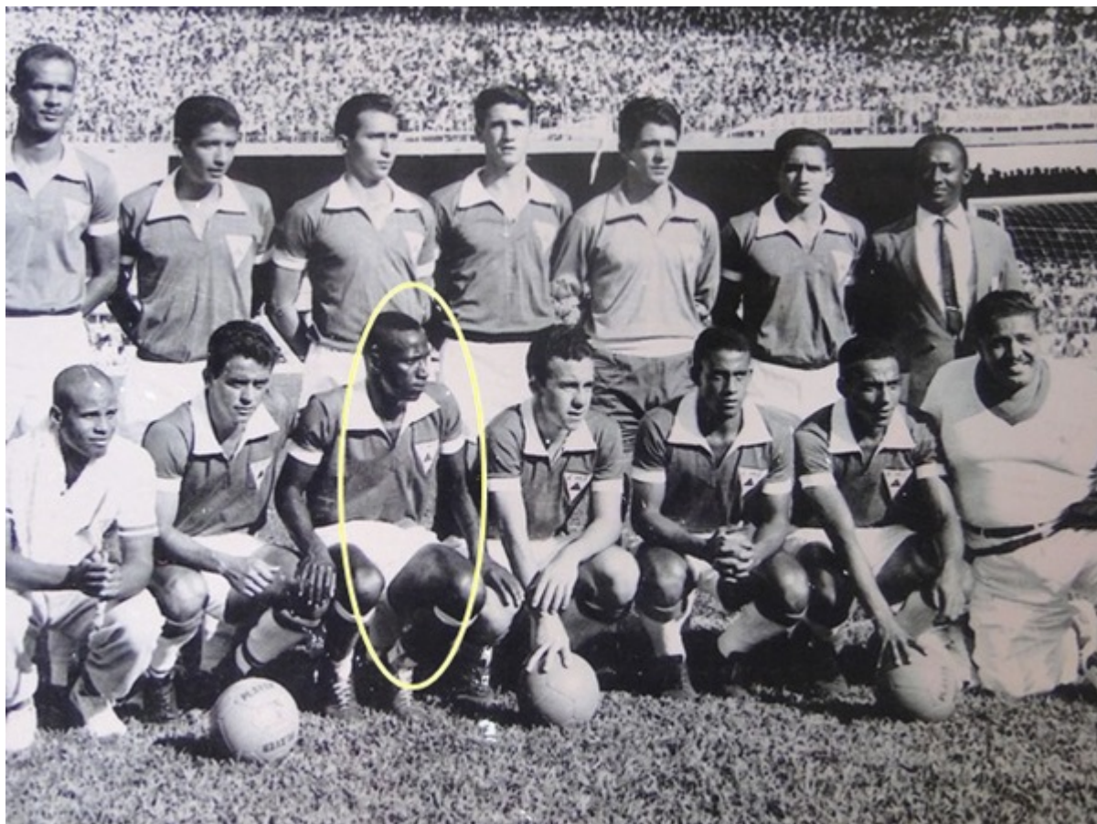
Seleção Mineira que participou da primeira partida do Mineirão.